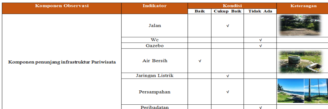
Tabel 3. Hasil Observasi Prasarana Penunjang Pariwisata Pantai Waitawar

Berdasarkan observasi diketahui bahwa komponen pendukung infrastruktur pariwisata khususnya di objek wisata Pantai Waitawar masih kurang memadai. Ada beberapa fasilitas infrastruktur yang rusak dan terbengkalai, serta beberapa fasilitas penunjang yang belum tersedia di tempat wisata, seperti toilet, gazebo, dan sarana ibadah. Berikut tabel hasil observasi infrastruktur pendukung wisata pantai Waitawar: